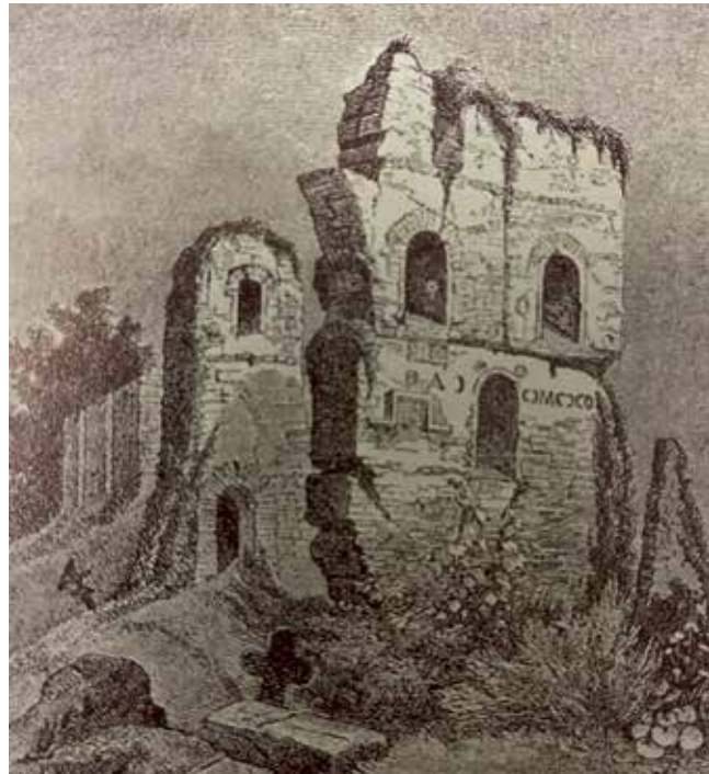
Руїни Десятинної церкви в Києві. Гравюра Паннемокера 1884 р. з малюнка невідомого художника початку XIX ст.

Взагалі, якщо говорити про подвиг мучеництва єпископату і духовенства у монголо-татарській навалі, то необхідно зазначити, що всі вони ревно залишалися з своєю паствою аж до смерті. Ми не маємо ніяких відомостей про те, що сталося з іншими єпископами: білгородським [?], юр'ївським Олексієм, володимиро-волинським Іоасафом. Їх кафедральні міста зазнали також нищівного спустошення. Відтак, знаємо, що владики: галицький Артемії та перемишльський Ларіон залишилися живими [7, с. 53, 96, 278, 368]. Поведінка тих єпископів, які залишалися у своїх кафедральних містах, щоб загинути разом з своєю паствою, повинна бути визнаною більш подвижницькою, аніж поведінка тих, хто, утікаючи, шукав більш безпечного місця від монгольської навали. Однак, не потрібно забувати, що в умовах татарського поневолення живий єпископ залишався тим святителем, який посвячував священників для служіння в церквах [2, с. 15].