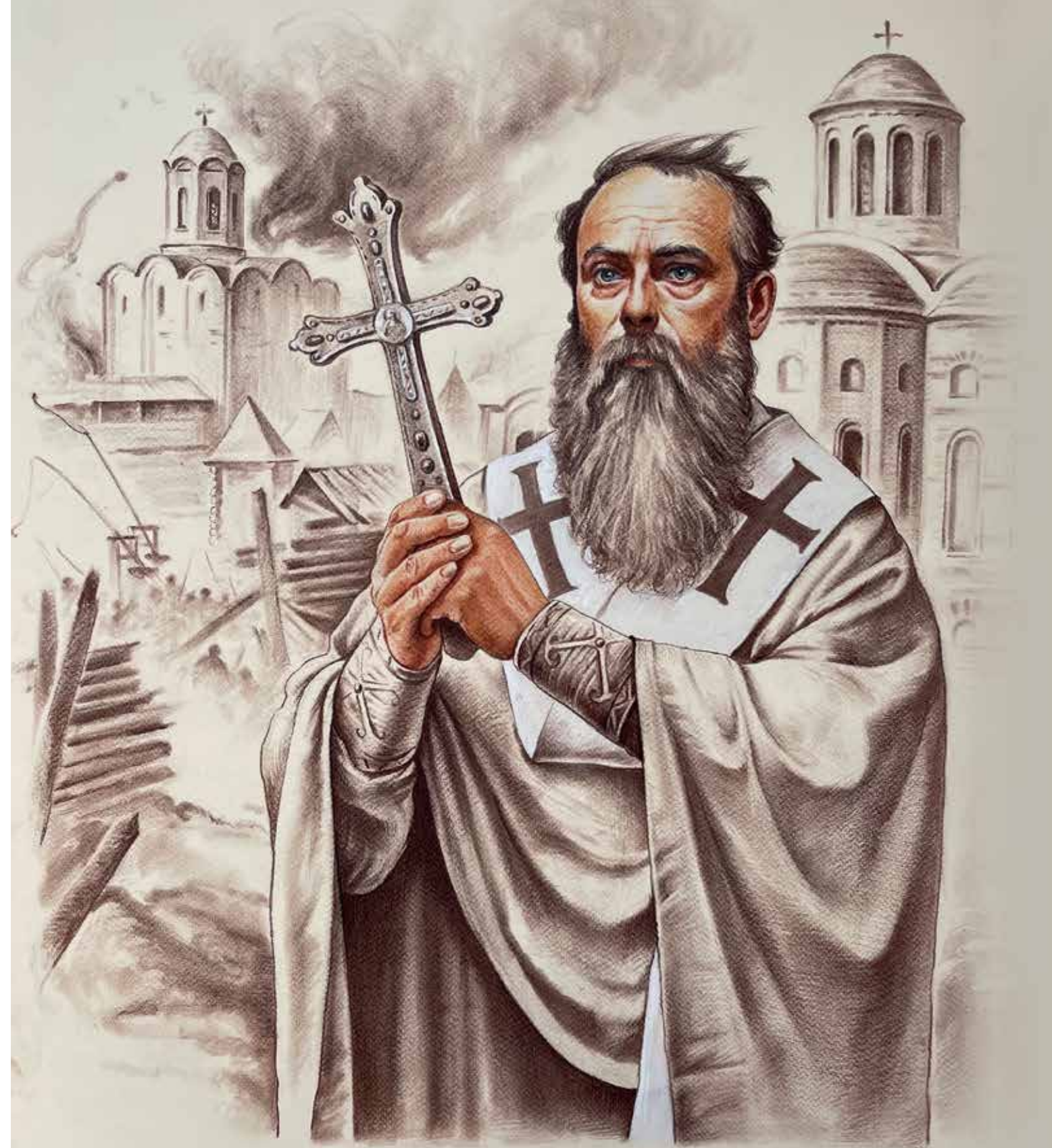
Йосиф митрополит Київський і всієї Руси (1236(1237) — 1240)