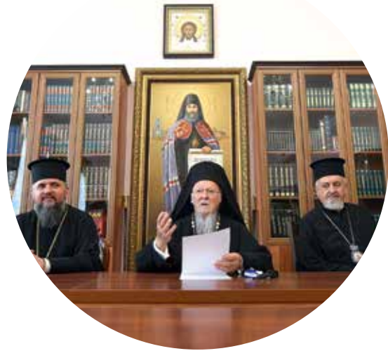
Блаженніший Митрополите Київський та всієї України кір Епіфаніє, Високопреосвященні та Преосвященні брати, Благословенні греки України, Любі та вельми бажані діти нашої Мірності,

З великою радістю і зворушенням я звертаюся до греків у Києві, які є втіленням та продовженням довгої та яскравої історії присутності, доброго свідчення, широкого сприяння суспільному життю, а також вірності традиціям грецької мови та життєздатним Вселенським цінностям, якими наділив цивілізацію давньогрецький дух і які становлять навічне надбання людства.