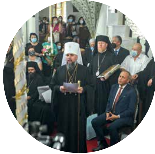
Ваша Всесвятосте! Ваше Блаженство! Брати-архієреї, шановний клір, дорогі брати і сестри!

Велика сердечна радість для нас сьогодні цією Божественною літургією, цією спільною молитвою подяки відзначити 60-ліття від часу рукоположення Вашої Всесвятості у сан диякона. Від тих днів змінилася епоха, радянський комунізм зазнав поразки, Церкви, які страждали тоді від важких гонінь — отримали можливість зростати у свободі, Всеpravославний Собор, який був у той час лише добрим побажанням і мрією — успішно відбувся під Вашим головуванням.