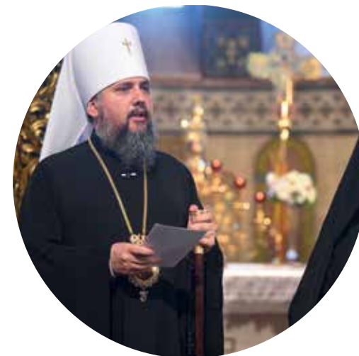
Ваша Всесвятосте, дорогий і улюблений у Господі Архієпископе Константинополя — Нового Риму і Вселенський Патріарше владико Варфоломій, наш співбрат і співслужитель, достойний Предстоятелю нашої Матері-Церкви! Дорогі брати у Господі — архієреї, клірики та миряни, які супроводжують Його Всесвятість у цьому історичному візиті до України!

Від повноти Помісної і Автокефальної Православної Церкви України, особисто від себе найперше хочу подякувати Вам, Ваша Святосте, що попри різні обставини, які могли завадити Вашому візиті саме в цей час, Ви прибули в Україну на запрошення як Церкви, так і Української держави в особі Президента, щоби молитовно розділити з українським народом радість свята — 30-ліття відновлення Незалежності України.