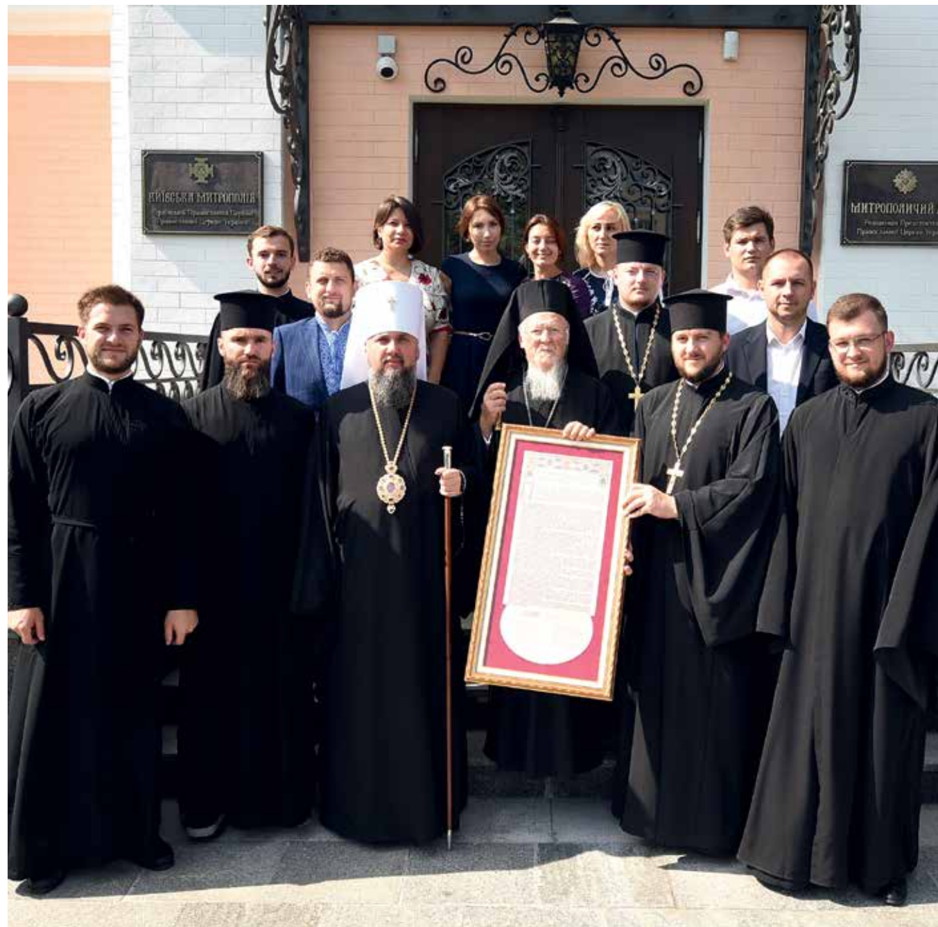
Перед від'їздом Вселенського Патріарха Варфоломія до аеропорту Бориспіль, Блаженніший Митрополит Київський і всієї України Епіфаній передав Його Всесвятості копію Томосу про автокефалію Української