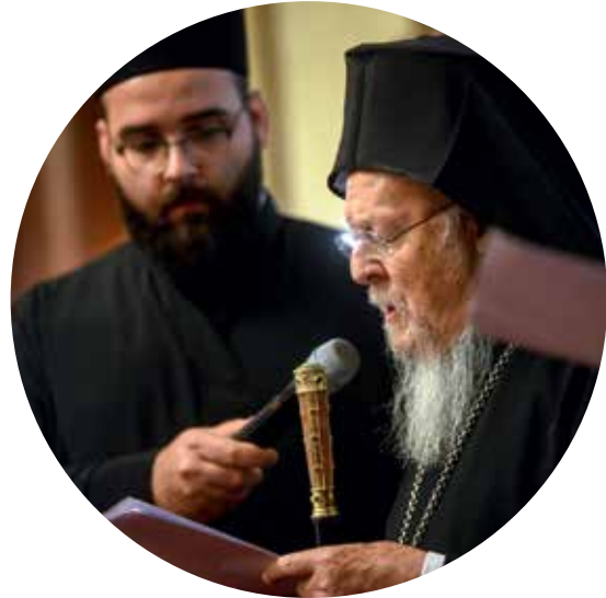
Ваші Пресвященства і Високоповажності, Пані та панове,

З великою вдячністю і радістю ми приймаємо присвоєне Національним університетом «Києво-Могилянська академія» нашій смиренній особі звання почесного доктора. Ми вважаємо цей жест вшануванням Вселенського Патріархату, Великої Церкви Христової, визнанням багатьох її ініціатив, особливо у питаннях, пов'язаних з діалогом, єдністю, турботою про творіння, солідарністю і миром.