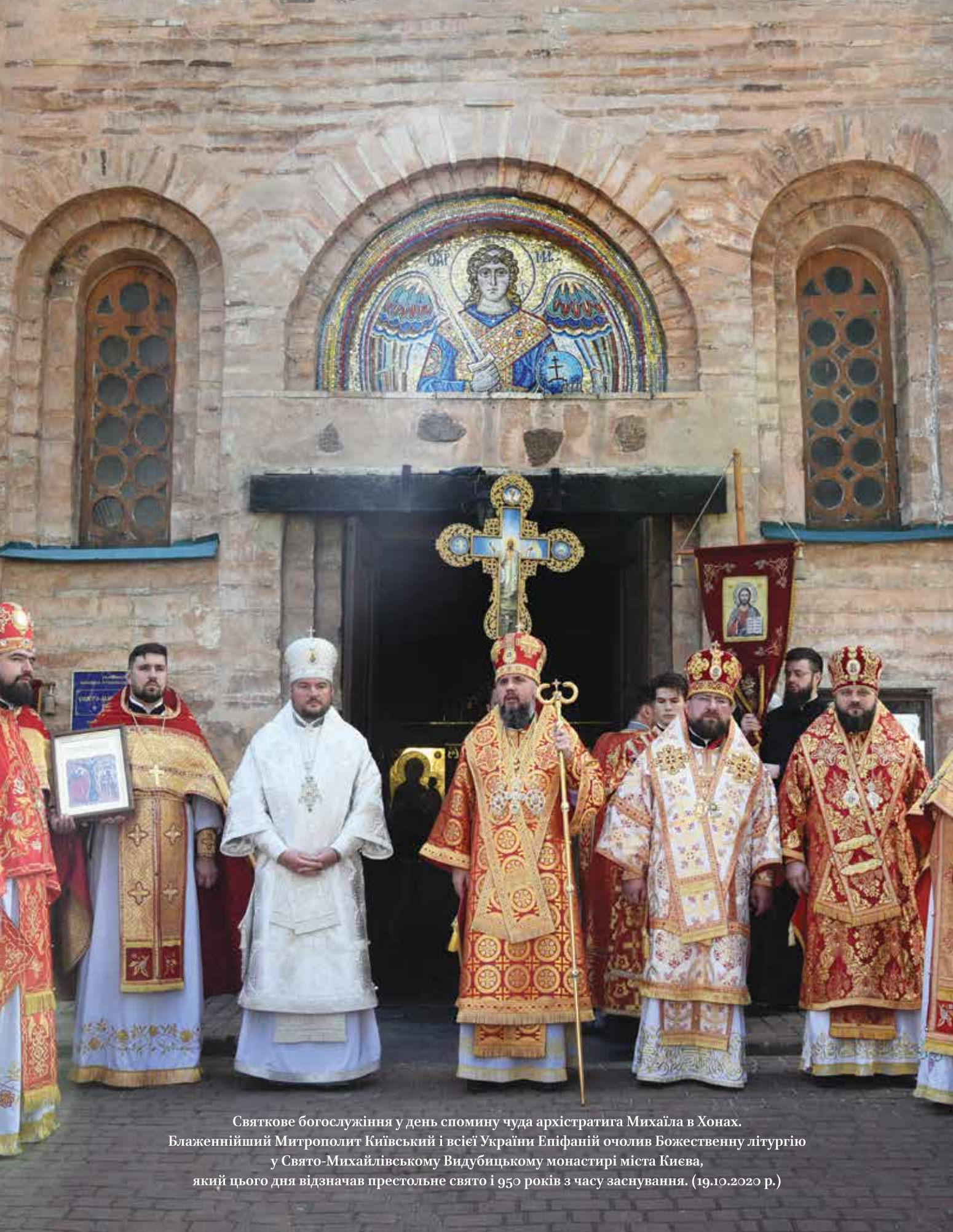
Святкове богослужіння у день спомину чуда архістратиґа Михаїла в Хонах. Блаженніший Митрополит Київський і всієї України Еліфаній очолив Божественну літурґію у Свято-Михайлівському Виду́бицькому монастирі міста Києва, який цього дня відзначає престольне свято і 950 років з часу заснування. (19.10.2020 р.)