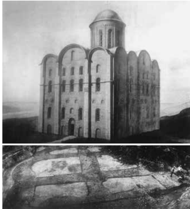
Церква св. вмч. Федора Тирона 1132 р.

смирений митрополит Михаїл із хрестом. І дав Ярополк Ольговичам отчину їхню, чого вони й хотіли. І так утишив розважливий князь Ярополк борню ту лютую» [8, с. 189].