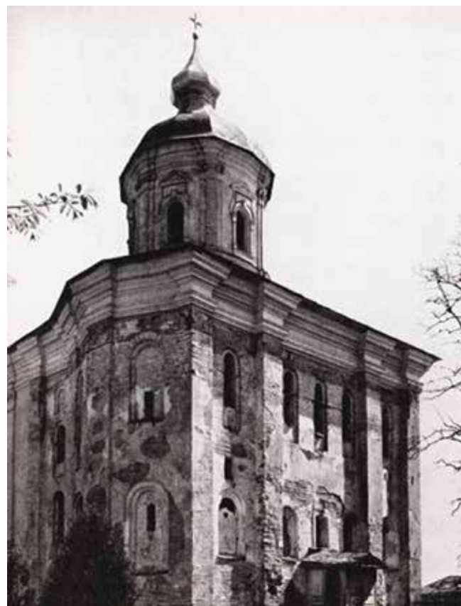
Михайлівська церква Видубицького монастиря 1070 р. Реставрація проходила у 1767-1769 рр.

Ярослава Мудрого): «В літо 1070 було закладено церкву святого Михаїла у Всеволодовому монастирі на Видубичах», – повідомляє «Повість минулих літ». «В літо 1088 була освячена церква святого Михаїла у Всеволодовому монастирі», – продовжує повістувати літопис. Однак розкопки Звіринських печер, проведені на початку 20 ст. підтвердили той факт, що монастир