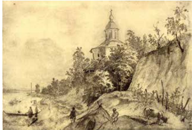
Видубицький монастир. Картина пензля Тараса Шевченка, 1844 рік.

у 1250 р. (перед поїздкою до Орди), тощо. А у 1146 р. тут навіть перебував в ув'язненні князь Ігор II Ольгович.