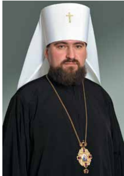
МИТРОПОЛИТ ЛЬВІВСЬКИЙ І СОКАЛЬСЬКИЙ ДИМИТРІЙ (РУДЮК), голова Інституту церковної історії

Рустинський літописець свідчить, що «був сей митрополит життя святого...» [5, с. 68], і серед своїх сучасників заслужив характеристики «миротворця», бо майже тричі мирив князів в міжусобиці, яка настала після смерті великого князя Мстислава-Федора Володимировича (1125 – 1132). Після упокоєння митрополита Микити (+ 1126) київська кафедра невідомо з яких причин залишалася вдовуючою чотири роки. Святитель Михаїл прибув до Києва тільки влітку 1130 року, відповідно пройшовши всі таїнства посвяти в Константинополі від Патріарха Іоана. Дійсно митрополиту Михаїлу II 1132 р., проживши всього лишень два роки під опікою князя київського Мстислава, який тримав твердо у покорі князів і був в «отця місто» [9, с. 149], прийшлося стати очевидцем міжкнязівської боротьби за Київ і за землі, які знаходилися в орбіті влади великих першопрестольних князів. Більш детально про ці події свідчить Новгородський літопис, який драматично їх характеризує: «Раздърася вся земля Русская» [10, с. 6]. У процесах примирення митрополит Київський Михаїл виявляв активність, хай навіть незавжди успішно [6, с. 296]. У 1134 р. він засудив спробу Ізяслава і Всеволода Мстиславичів